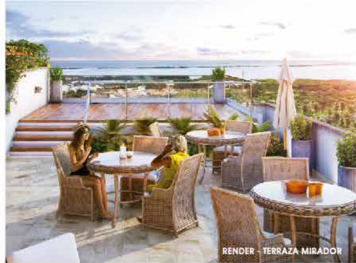
RENDER - TERRAZA MIRADOR

Amenidades, espacios diseñados con elegancia y sofisticación.