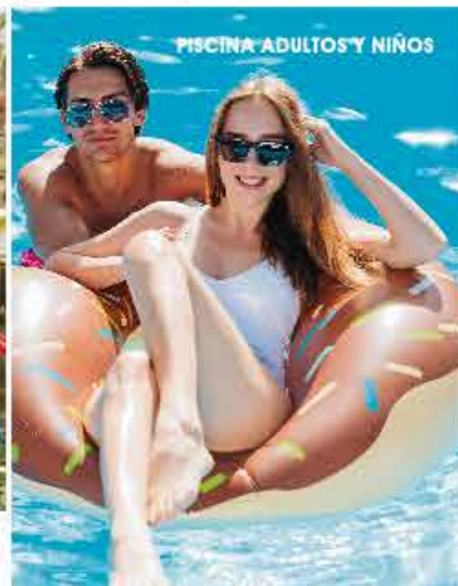
PISCINA ADULTOS Y NIÑOS

Todas las imágenes, perspectivas y planos de esta publicación son ilustrativos e incluyen elementos y acabamientos decorativos. El proyecto y las áreas ofrecidas pueden sufrir modificaciones, como consecuencia directa de órdenes dadas por la curaduría o la alcaldía competente en la expedición de la licencia de construcción, por caso fortuito y/o de fuerza mayor.