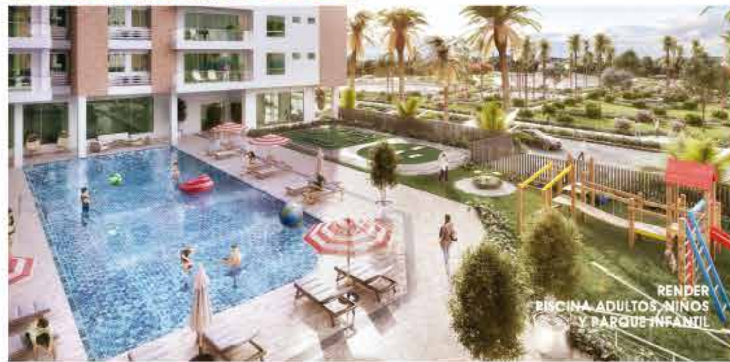
RENDER PISCINA ADULTOS, NIÑOS Y PARQUE INFANTIL

Todas las imágenes, perspectivas y planos de esta publicación son ilustrativos e incluyen elementos y acabamientos decorativos. El proyecto y las áreas ofrecidas pueden sufrir modificaciones, como consecuencia directa de órdenes dadas por la curaduría o la alcaldía competente en la expedición de la licencia de construcción, por caso fortuito y/o de fuerza mayor.