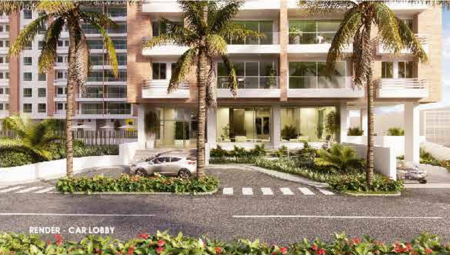
RENDER - CAR LOBBY