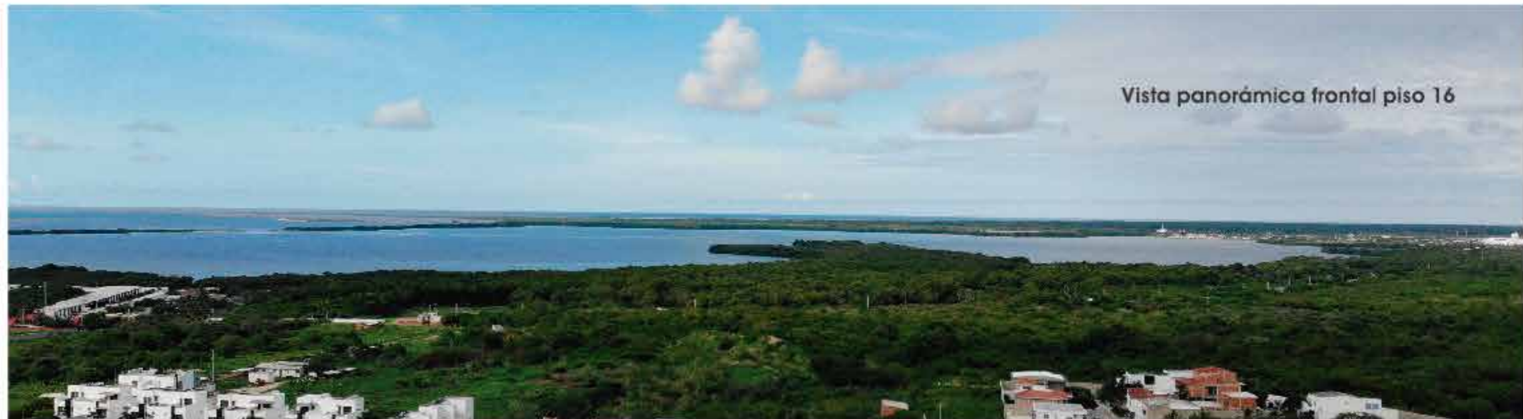
Vista panorámica frontal piso 16