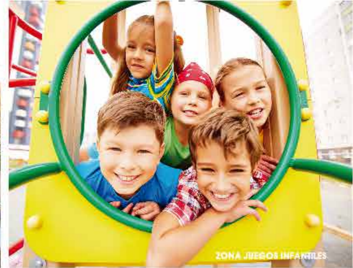
ZONA JUEGOS INFANTILES