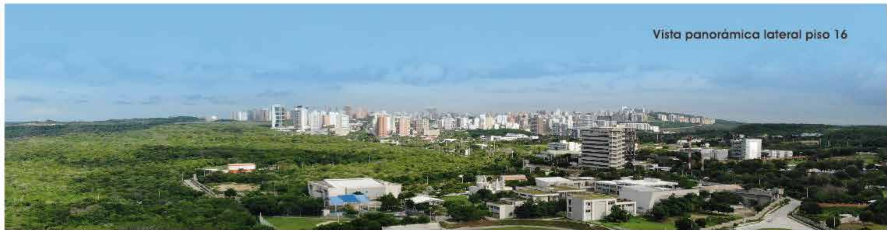
Vista panorámica lateral piso 16