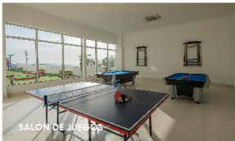
SALÓN DE JUEGOS