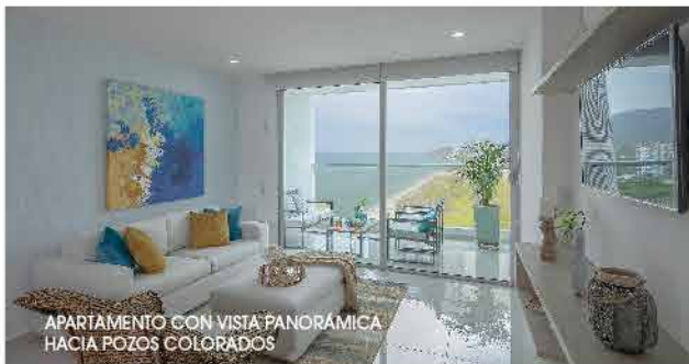
APARTAMENTO CON VISTA PANORÁMICA HACIA POZOS COLORADOS