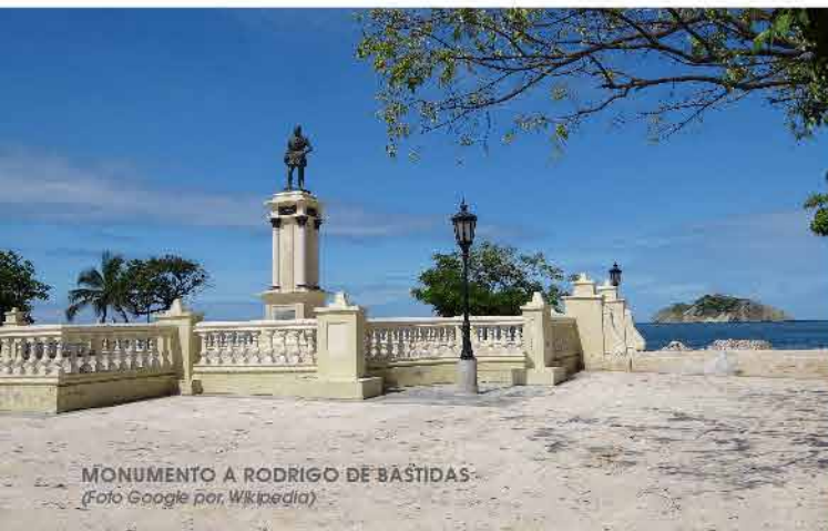
MONUMENTO A RODRIGO DE BASTIDAS

Poseedora de un patrimonio arquitectónico inmenso, paisajes hipnotizantes, y una rica cultura con tesoros coloniales, Santa Marta es otro de los puntos turísticos de Colombia con mayor visitas año a año.