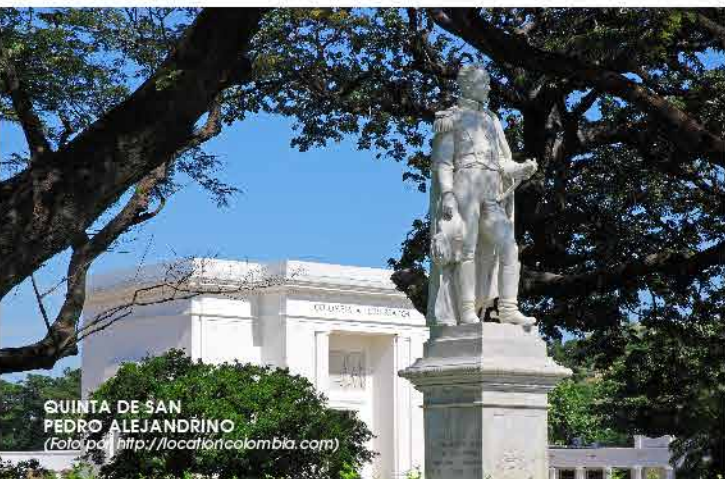
QUINTA DE SAN PEDRO ALEJANDRINO

Hace casi 500 años, en 1525, Rodrigo de Bastidas fundó el primer asentamiento de los españoles en Colombia: Santa Marta. En la búsqueda de los europeos por nuevas rutas comerciales, fue descubierto un paraíso con historia y tradición indígena que aún hoy cautiva a miles de viajeros nacionales e internacionales.