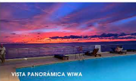
VISTA PANORÁMICA WIWA

Ser propietario en WIWA es disfrutar y vivir la exclusividad frente al mar.