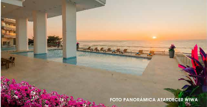
FOTO PANORÁMICA ATARDECER WIWA