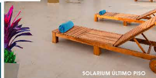
SOLARIUM ÚLTIMO PISO

Espacios donde puedes transformar y relajar tus sentidos.