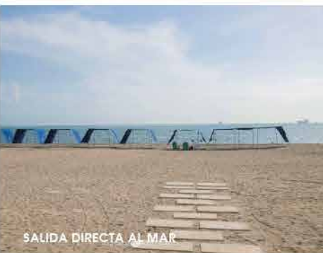
SALIDA DIRECTA AL MAR