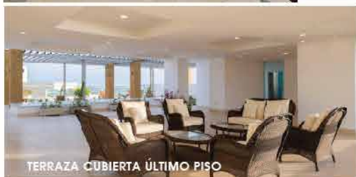
TERRAZA CUBIERTA ÚLTIMO PISO

Espacios donde puedes transformar y relajar tus sentidos.