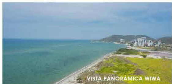
VISTA PANORÁMICA WIWA

Ser propietario en WIWA es disfrutar y vivir la exclusividad frente al mar.