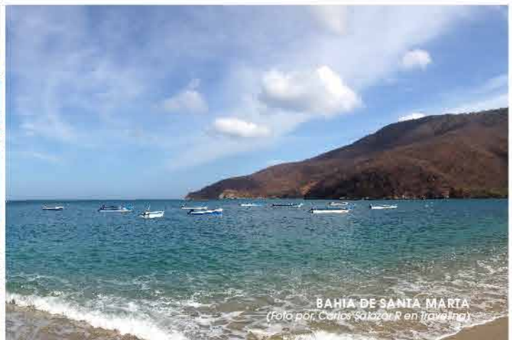
BAHÍA DE SANTA MARTA