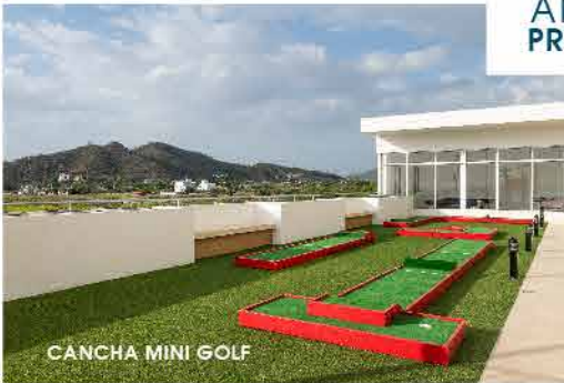
CANCHA MINI GOLF