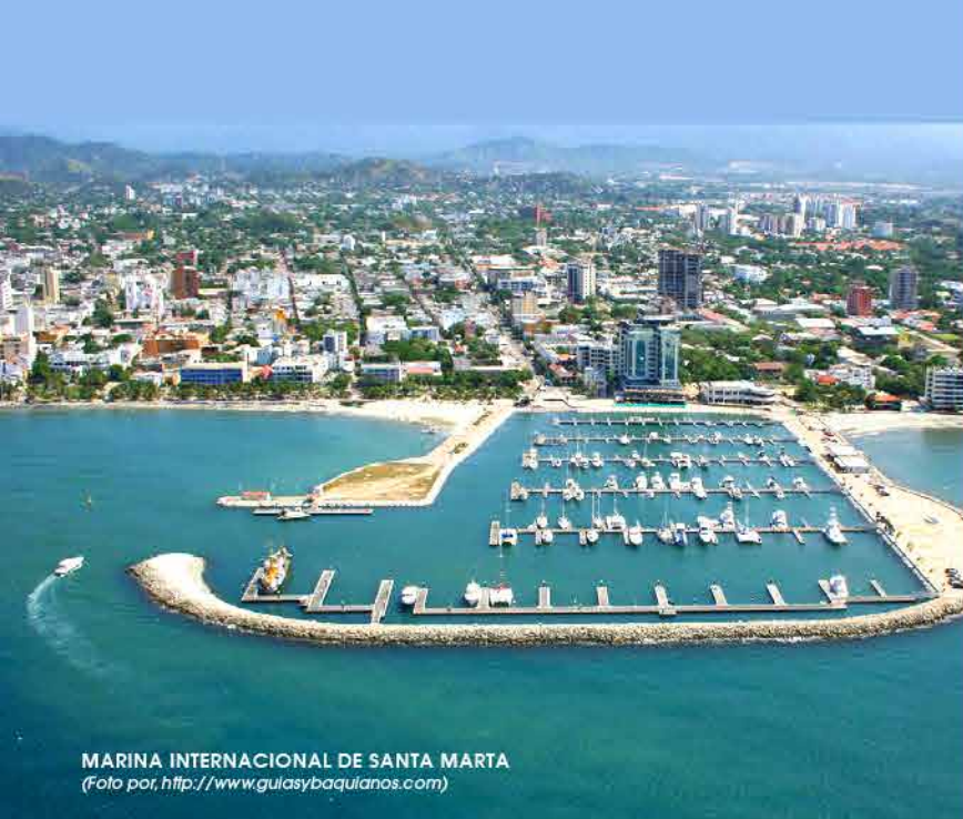
MARINA INTERNACIONAL DE SANTA MARTA