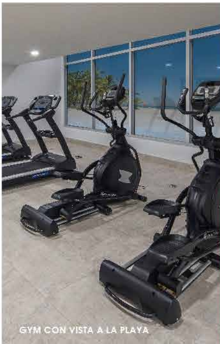
GYM CON VISTA A LA PLAYA