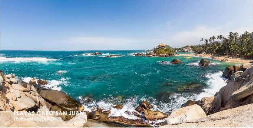
PLAYAS CARO SAN JUAN