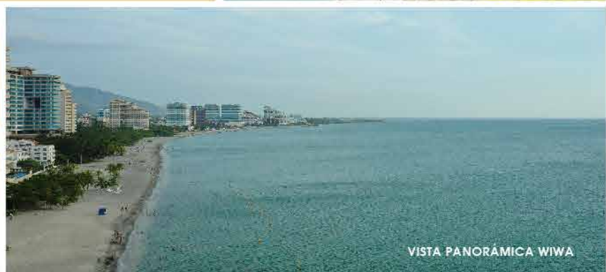
VISTA PANORÁMICA WIWA