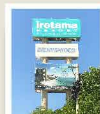
Foto de referencia ingreso a WIWA