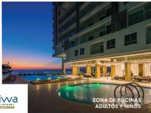
ZONA DE PISCINAS ADULTOS Y NIÑOS

Espacios diseñados para disfrutar, compartir con amigos y familia.