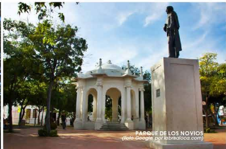
PARQUE DE LOS NOVIOS