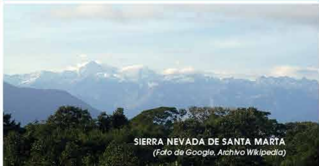
SIERRA NEVADA DE SANTA MARTA

Santa Marta tiene la montaña Costera más alta del mundo, esta majestuosa Sierra con sus cuspides nevados es epicentro histórico y cultural de civilizaciones indígenas como los Etnias Kogi, Arhuaco, Kankuamo y los Wiwa.