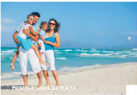
PRIMERA LINEA DE PLAYA

Espacios diseñados para disfrutar, compartir con amigos y familia.